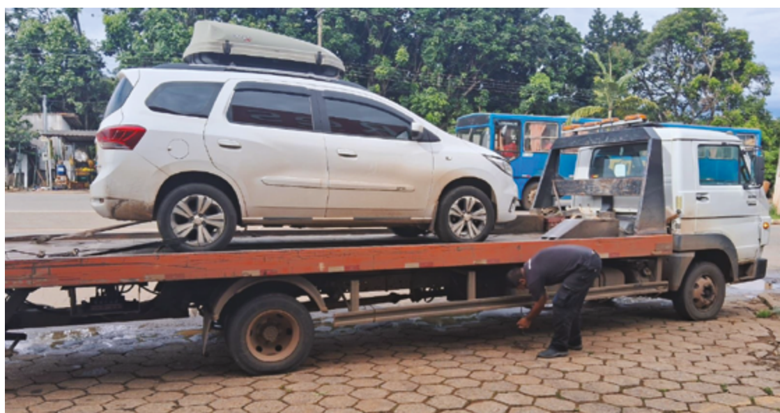
De segunda, 25, a quarta-feira, 27, os fiscais realizaram 56 abordagens e lavraram sete autos de infração

neste início de feriado prolongado e contaram com o apoio da Polícia Militar do Estado de Goiás (PMGO) e da Polícia Rodoviária Federal (PRF). Desta vez o foco principal foram as rotas turísticas.