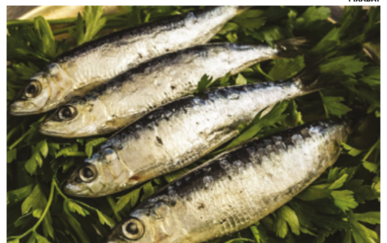
Consumo de peixe vai além do sentido religioso, traz benefícios saudáveis

Também é preciso ser sustentável ao escolher o pescado que será consumido. "É crucial garantir que esses alimentos sejam originados da pesca responsável. Escolher variedades sustentáveis ajuda a promover a preservação dos recursos naturais e a manutenção do equilíbrio dos ecossistemas marinhos, contribuindo