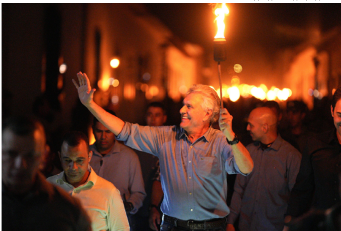
Ronaldo Caiado durante percurso pelas ruas: governador enalteceu procissão e valores da goianidade

O governador seguiu uma tocha e realizou todo percurso da