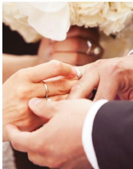
Registros mostram que 3724 matrimônios foram realizados e 928 uniões desfeitas

Já a capital goiana, que reúne mais de 1,4 milhão de habitantes, também ficou na média na proporção de casamentos contra divórcios. Ao todo foram 10.963 uniões matrimoniais e 4744 separações apenas em 2022.