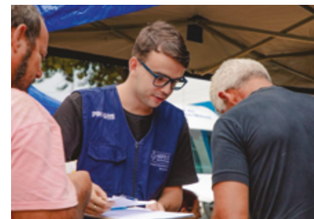
Atividade é realizada durante todo o mês de abril e conta com mais de 30 empresas

Além do atendimento presencial na sede do Procon, de 22 a 26 de abril, na Praça Dom Emanuel, no Bairro Jundiá, estarão disponíveis a carreta da Caixa Econômica Federal e duas vans de atendimento móvel do órgão. Os interessados poderão usufruir dos serviços das 9h às 17h. Vale destacar que durante os 30 dias de ação, o atendimento será ininterrupto, inclusive durante o horário de almoço.