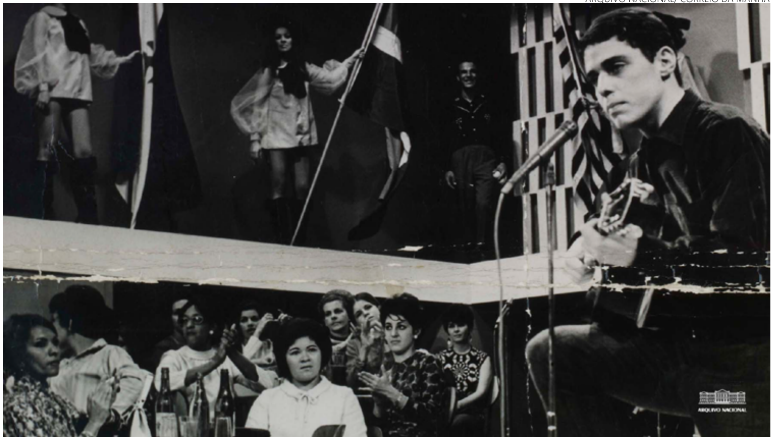
Chico Buarque faz show na extinta TV Rio, em agosto de 1967: artista se exilou dois anos depois e foi um dos mais censurados na música popular brasileira

Eram frequentes visitas a shows, intimidades a depoimentos forçados e censura a canções. Hoje, aos cuidados do Arquivo Nacional, os documentos - que podem ser obtidos via Lei de Acesso à Informação pela sociedade civil - detalham ainda quando os