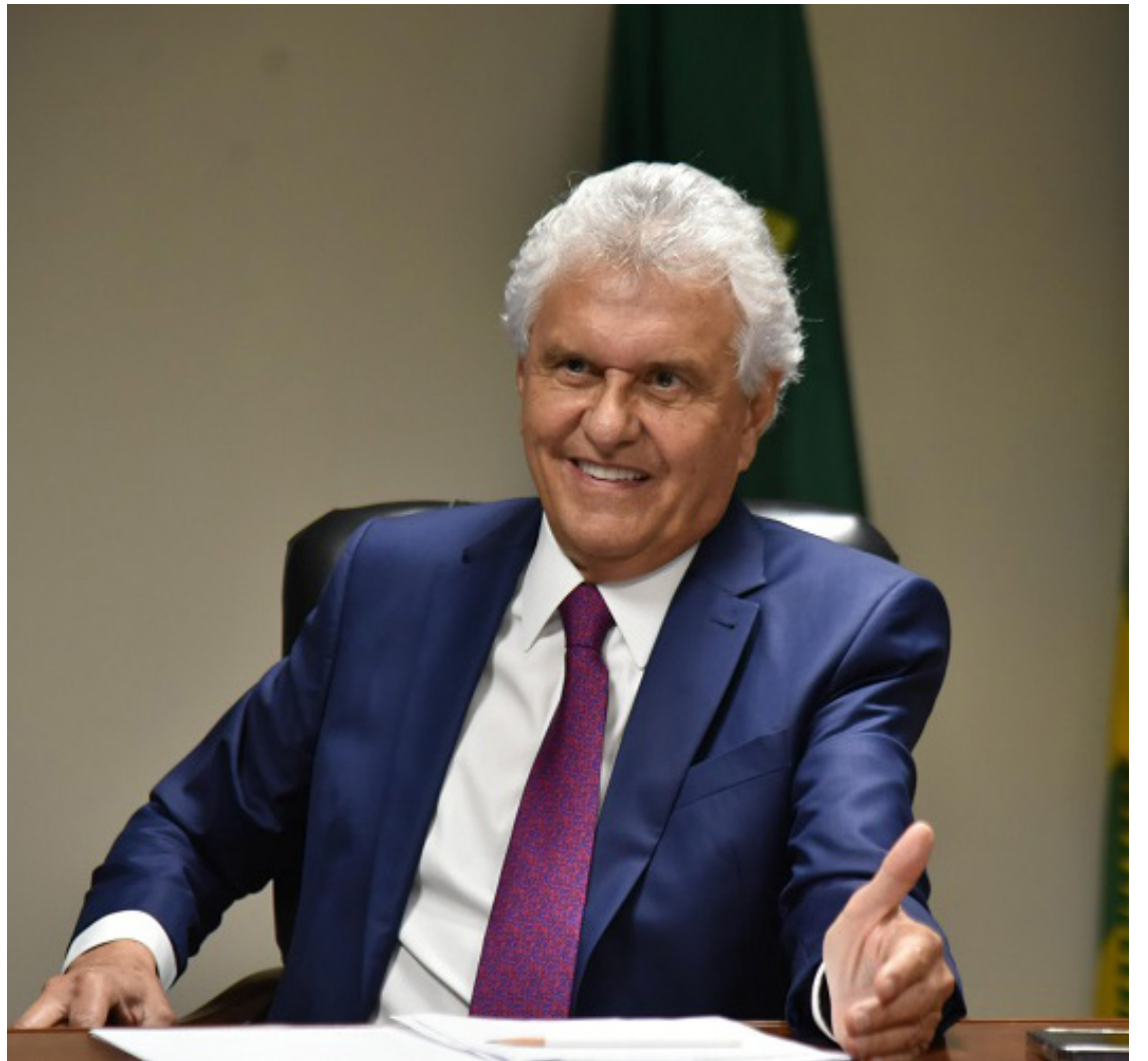
Ronaldo Caiado avança junto ao eleitorado da direita para as eleições presidenciais

Em recente entrevista à Folha de S. Paulo, Caiado considerou que tem o mesmo eleitorado de Bolsonaro e disse que pretende trabalhar para viabilizar seu nome na disputa pelo Palácio do Planalto em 2026 com o apoio do ex-presidente, isso, claro, se o liberal não tiver