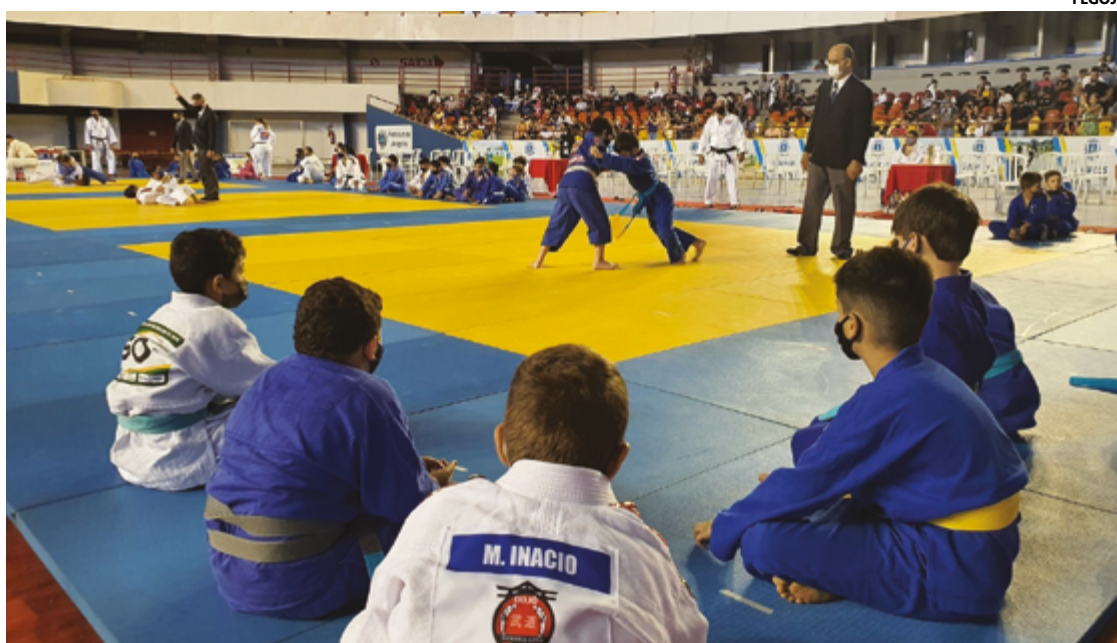
Competição é aberta ao público, sem necessidade de retirada de ingressos, no Ginásio Internacional Newton de Faria

Amaral informa que não é a primeira vez que a Fegoju faz esse tipo de evento em Anápolis. “Já foram várias vezes, Anápolis está se tornando a capital